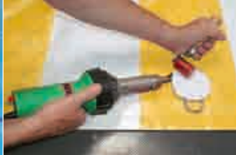
Наварка крепежной накладки при помощи ТРИАК S.