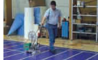
Армирование тентового покрытия с помощью армирующей ленты аппаратом ТЭЙПМАТ.

автомобильных тентов, палаток, рекламных баннеров, бассейнов, биотопов, укрывных тентов для легких судов и для бассейнов, промышленных завес, укрывных тентов для сельского хозяйства и т.п.