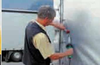
Аппарат ТРИАК PID с щелевой насадкой и прикаточный ролик при ремонте тентового покрытия грузового автомобиля.