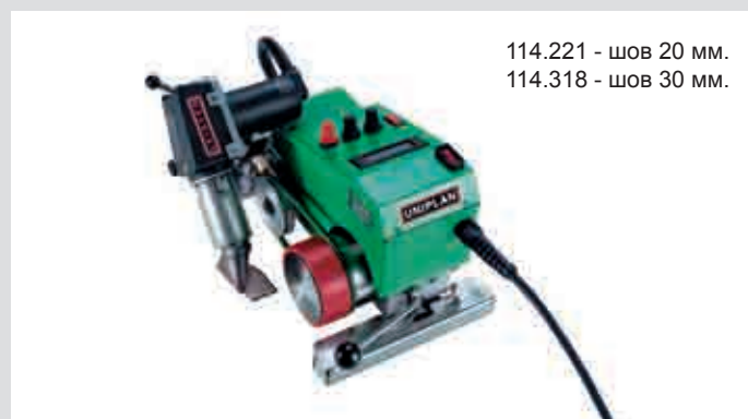
114.221 - шов 20 мм. 114.318 - шов 30 мм.

Для квалифицированной сварки горячим воздухом тентовых тканей. Направляющий ролик точно ведет УНИПЛАН по шву. Дисплей с отображением показателей заданной и реальной температуры, а также скорости сварки. Электронная регулировка нагрева.