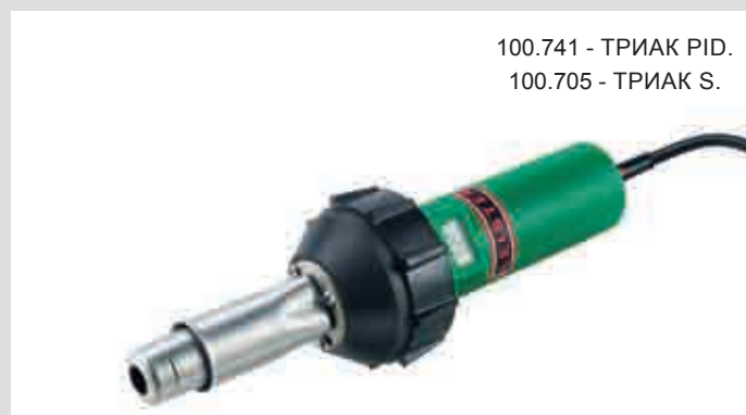
100.741 - ТРИАК PID. 100.705 - ТРИАК S.

Электронная регулировка температуры сварки и контроль за функциями через микропроцессор. Данные ручные аппараты предпочтительны для выполнения работ, где к качеству шва предъявляются высокие требования.