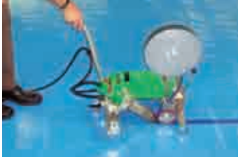
Автомат УНИМАТ для сварки лентой при наварке упрочняющей ленты 40 мм на ПВХ-ткань.