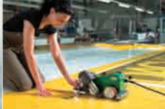
УНИПЛАН E при сварке внахлест рекламного баннера.